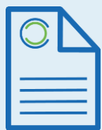
ESTUDO DE CARACTERIZAÇÃO DO SETOR DOS RCD

Este projeto aposta assim na sensibilização para a prevenção da produção dos RCD assim como para a sua valorização, ao promover a sua incorporação na indústria e na construção, permitindo a diminuição da pegada de carbono dos sectores, a redução da extração de recursos naturais e o desvio de resíduos para aterro.